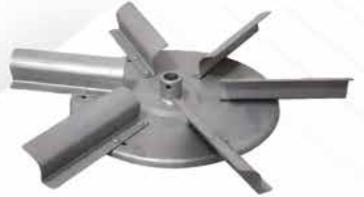
Gübre Serpme Pervane