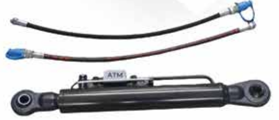
Ortakol Pistonu (50-55-60-65 Cm)