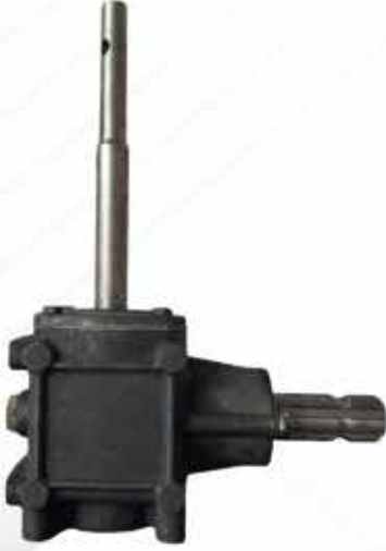
Gübre Serpme Pik Şanzıman