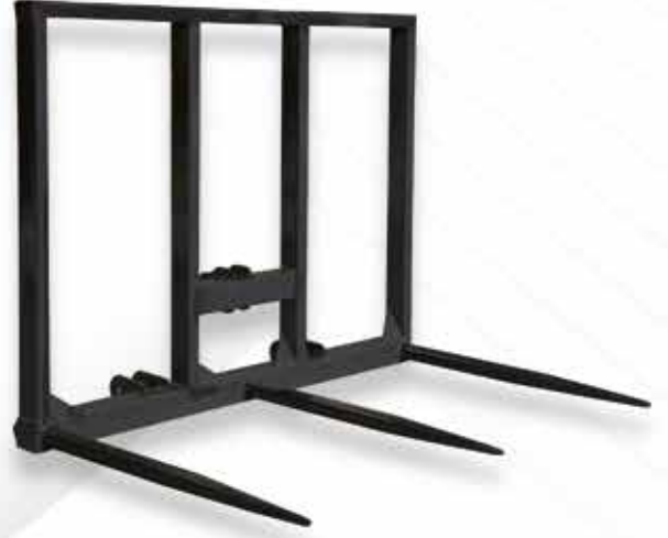
Rulo Balya Ataçmanı